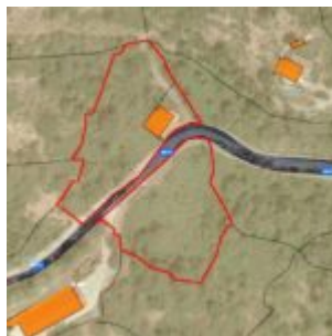
PLANIMETRIA DELIMITAZIONE PROPRIETA'