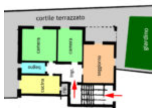
PLANIMETRIA INTERNO ED ESTERNO