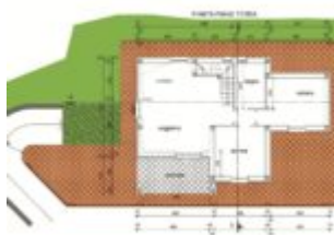
PLANIMETRIA PIANO TERRA