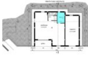
PLANIMETRIA PIANO -1 DELIMITAZIONE PROPRIETA'