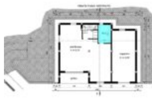
PLANIMETRIA PIANO -1 DELIMITAZIONE PROPRIETA'